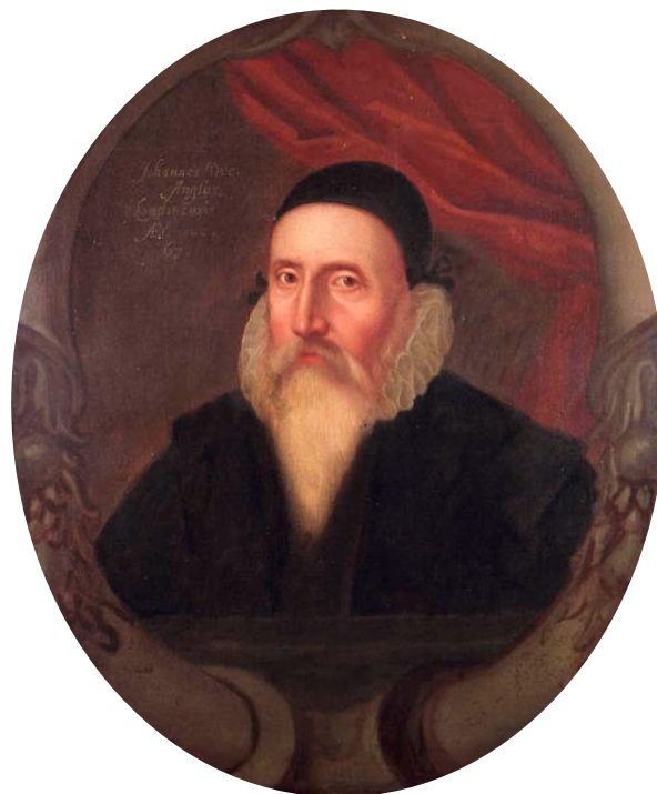
Dr. John Dee, Magus et Magister