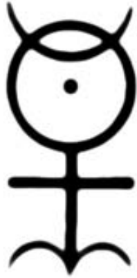
Glyphe Personnel de John Dee (Mona Hieroglyphica)